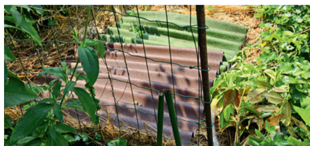
Einfache Schutzmassnahmen für Blindschleichen auf dem Kompost.

Die Überpopulation von Katzen stellt ein wachsendes Problem für die heimische Tierwelt dar. Mit schätzungsweise 1,9 Millionen Katzen üben sie einen erheblichen Druck auf einheimische Arten, wie Vögel, Blindschleichen und Kleinsäuger aus. Laut einer Studie tötet jede freilaufende Katze pro Woche mindestens ein Wildtier. Ihre räuberische Natur führt zu einem Rückgang dieser Tierpopulatio-