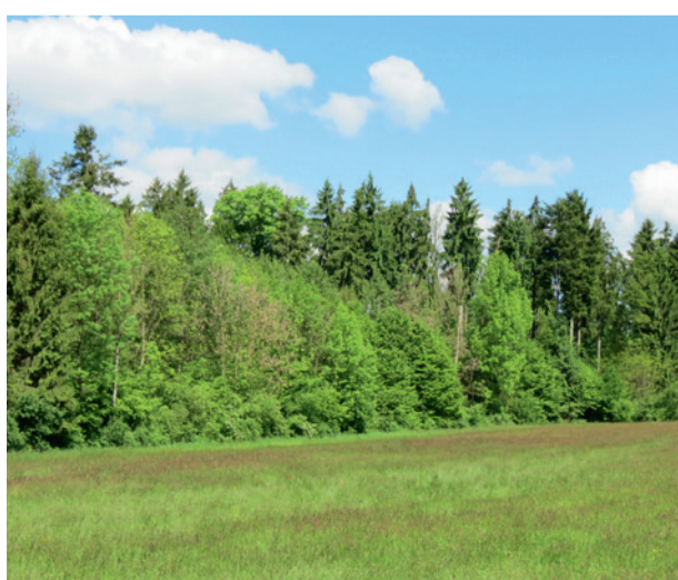
Ökologisch wertvoller, gestufter Waldrand

Ökologisch wertvolle Waldländer bilden ein fließendes Kontinuum zwischen Kulturland und dem Lebensraum Wald. Im Idealfall wird das Vorland extensiv bewirtschaftet und ist direkt mit einem strauchreichen Waldrandgürtel verzahnt, welcher erst allmählich und stufenweise in den Hochwald übergeht. Entsprechende Massnahmen wurden in Cham über viele Jahre durch den LLC unterstützt. Einerseits wurden gestufte Waldländer geschaffen, oder es wurde in die Folgepflege investiert. Allerdings sind die Möglichkeiten für weitere gestufte Waldländer in Cham rar. Meist liegt ein Weg direkt am Waldrand, das Vorland wird intensiv bewirtschaftet, oder ein Strauchgürtel fehlt. Ab 2025, mit dem überarbeiteten LEK, wird neu nur noch der Kanton für die Waldrandaufwertungen zuständig sein.