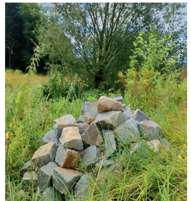
Zyklopensteine bieten ein dauerhaftes Gerüst, damit Hohlräume unter den modernden Ästen bestehen bleiben.