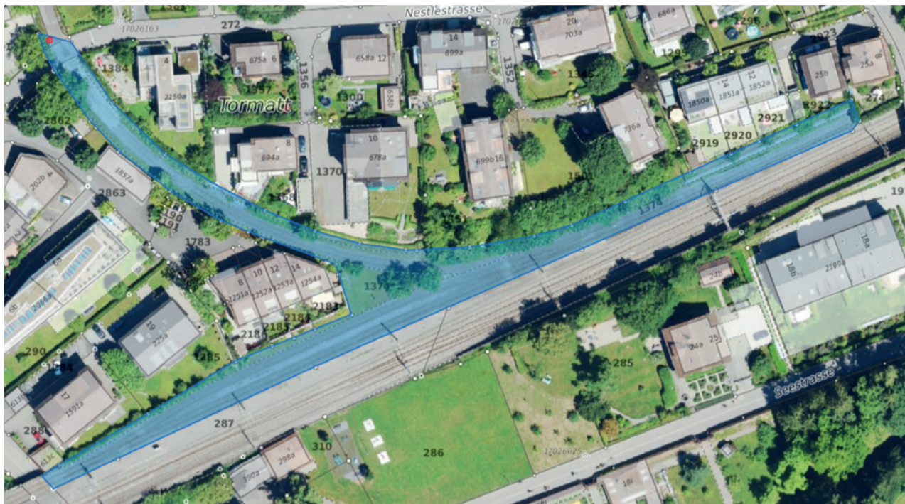
Perimeter des geplanten Insektenparadieses

Die Papierfabrik Cham verfügte zwischen 1920 – 2014 über einen direkten Gleisanschluss. Der nördliche Teil des ehemaligen Papiergleises wurde bereits 2021 in einen Velo- und Fussgänger-Highway umgestaltet. Auf dem 30a grossen Areal südlich der Nestléstrasse bis zum Anschluss an die SBB Geleise soll im Frühling 2025 ein grosses Insektenparadies entstehen. Das Projekt des Vereins Lebensraum Landschaft Cham (LLC) wird über Drittmittel finanziert und von der Gemeinde und Kanton unterstützt.