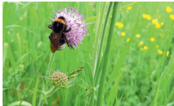
Hummeln, gehören zu den Wildbienen und sind auf einheimische Blüten und offenen Boden angewiesen.