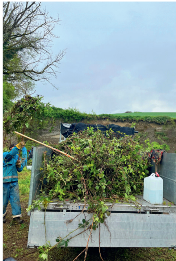
Der Verein Naturnetz beim Ausstocken der Brombeeren.