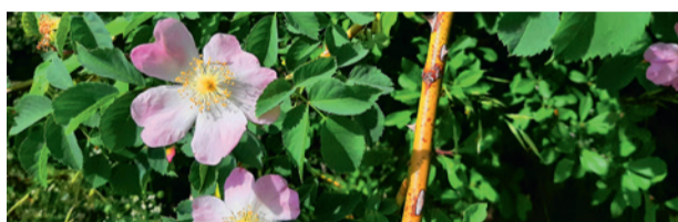
Rosa canina ist die häufigste der rund 30 Wildrosenarten der Schweiz.